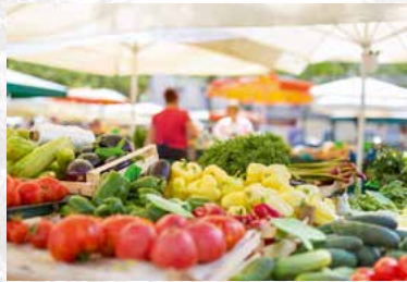
Le marché de Paramé, les mercredis et samedis