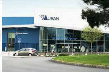
À 6 min à pied du cinéma Vauban