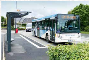
À 100 m des arrêts de bus lignes 4 et 7