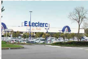
À 500 m de la zone commerciale