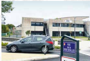
À 6 min à pied de l'IUT