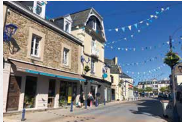
À 15 min à pied, le cœur de Paramé