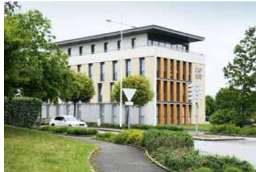
Le centre médical Cap Sud à 100m